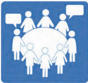
Demokratie und Beteiligung

Die Bürger in Deutschland fühlen sich nicht mehr ausreichend in der Regierungsarbeit vertreten und wünschen eine direkte Beteiligung. Durch das Gefühl der Machtlosigkeit („Die machen ja sowieso, was sie wollen“) entsteht eine immer größere Politikverdrossenheit. Um dies zu ändern, fordern wir Bürger ein Bürgerforum! Hier sollen transparente Information und direkte Beteiligung möglich sein, die gesetzlich geregelt sind und die die Demokratie stützen und verbessern.